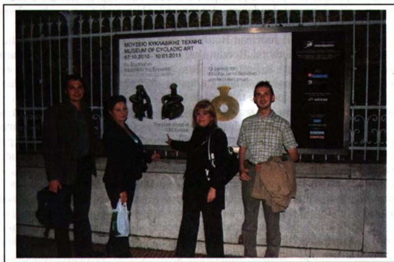
Fig. 4 Cercetători din România (Botoșani și Iași) la vernisajul expoziției de la Atena