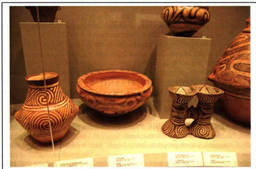
Fig. 3 Piesele Muzelui Botoșani în expoziția de la Atena