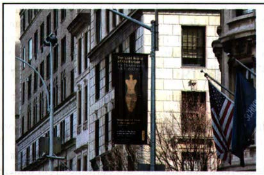
Fig. 1 Afișul în New York

„Magnific. Găsesc interesantă asemănarea în ce privește dimensiunile cu lucrările miceniene și grecești. De asemenea, am văzut o oarecare asemănare a decorațiilor de pe aceste vase și grafică veche europeană. În final, un mare univers a fost descoperit.”