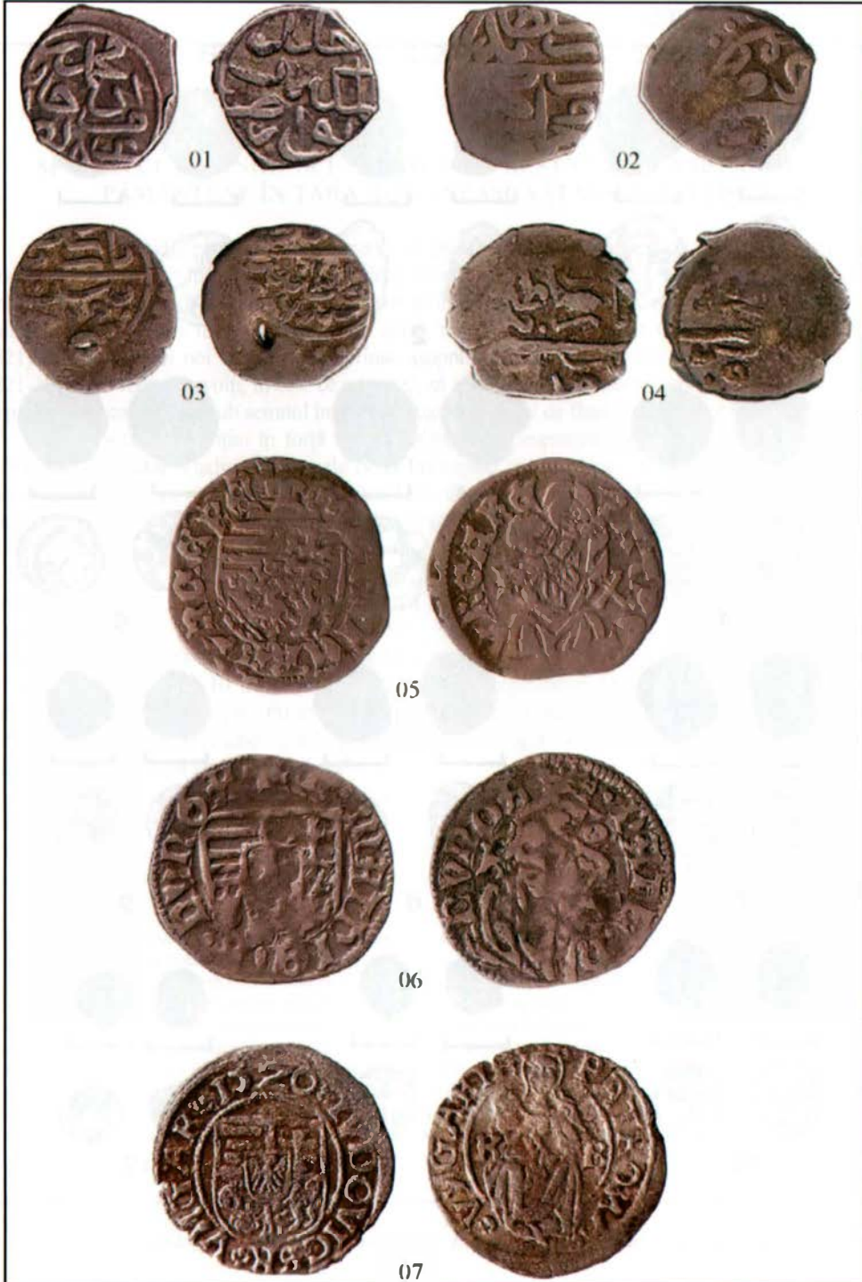
Fig. 1 – Emisiunile otomane (nr. 01-03, o imitație după asprii otomani (nr. 04) și ungare (nr. 05-07) din colecția D-lui A.V. Tocmacov.