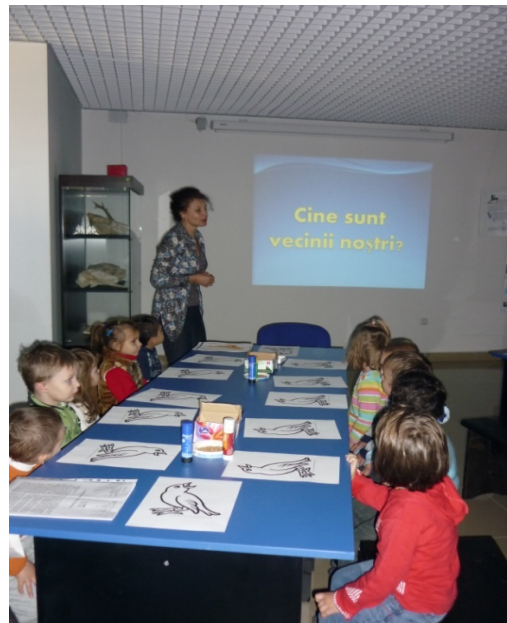
Fig. 2. Prezentarea materialului P.P.