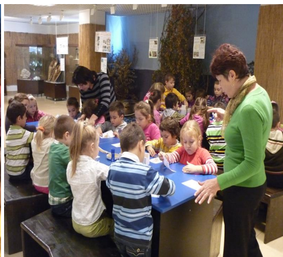
Fig. 4. Jocul: învățăm un cântec.