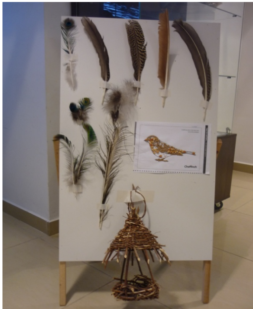
Fig. 1. Pregătirea materialului de lucru.