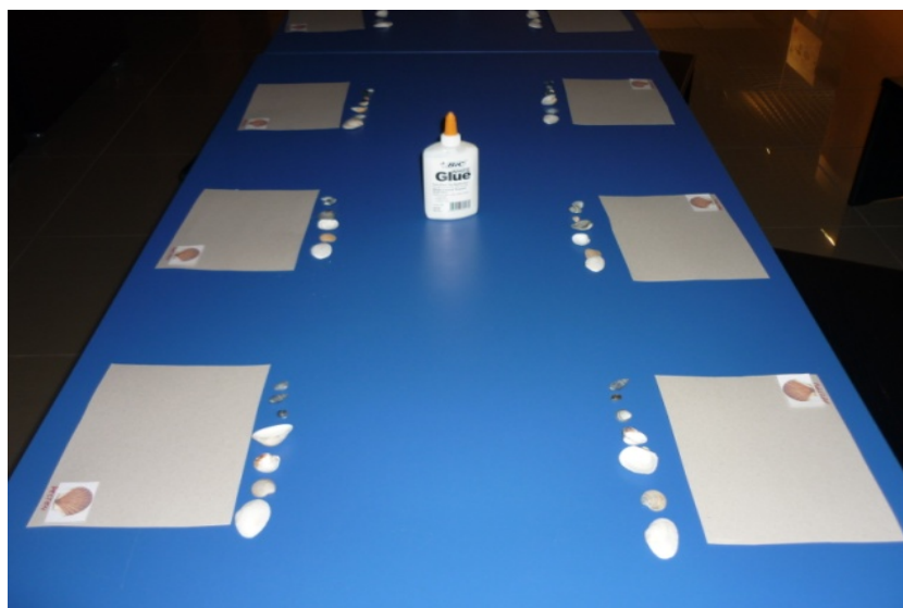
Fig. 1. Pregătirea materialului de lucru.