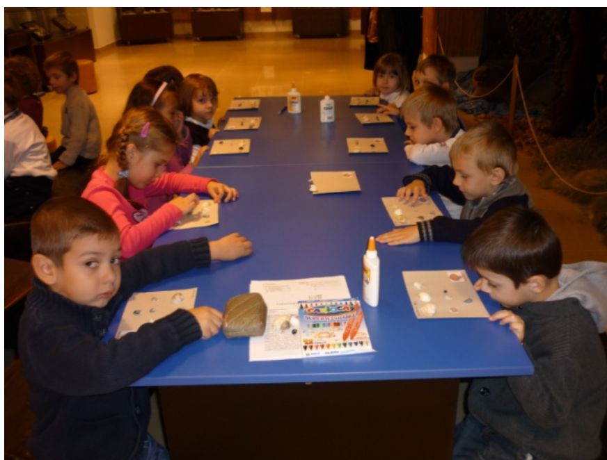
Fig. 2. Etapa practică cu preșcolarii.