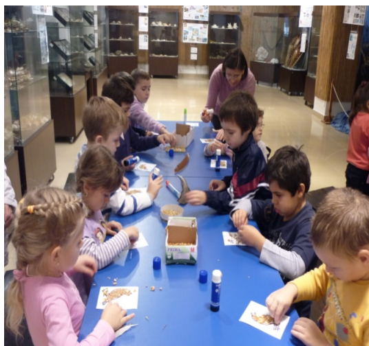
Fig. 3. Lucrul cu copii.