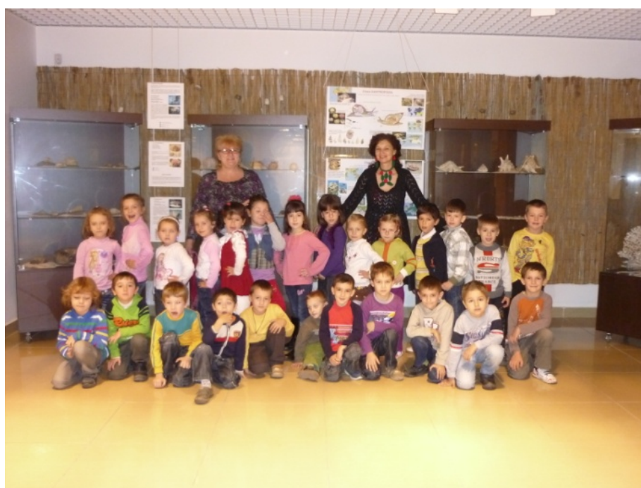
Fig. 4. Fotografia colectivă.