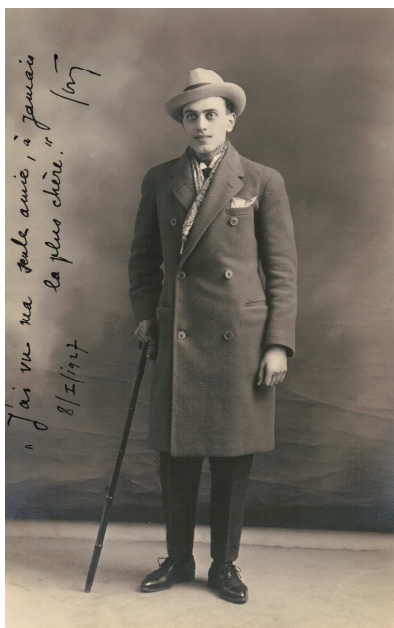
1927 – Paris Pierre Charles Photographe Faub. Montmartre 42.