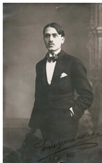
1915. Calea Rahovei 3 București