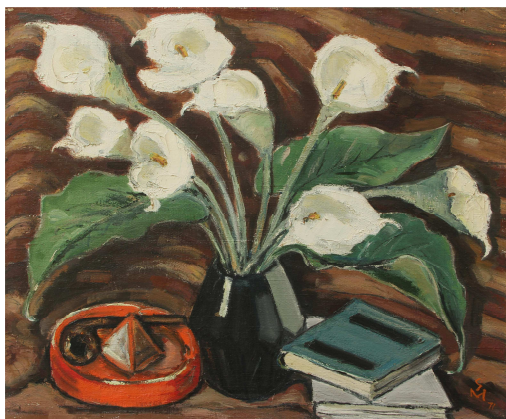
Cale. Ulei/pânză, 50x60 cm, semnat și datat dreapta jos cu roșu SM 71. Colecție particulară.