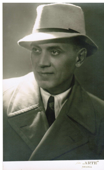
1940. Brăila