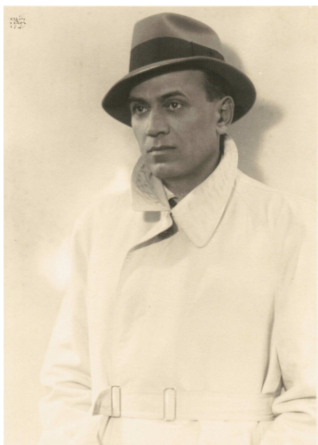
1940. Klein. Brăila, Calea Călărași 8.