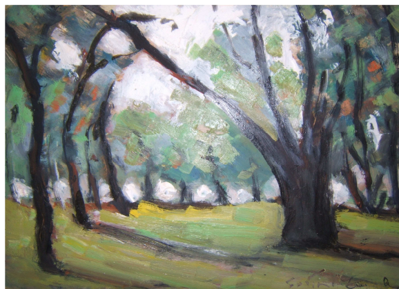
Pădure. Ulei/carton, 30,8x42,5 cm, semnat dreapta jos cu negru Sorin Manolescu, nedatat. Colecție particulară.