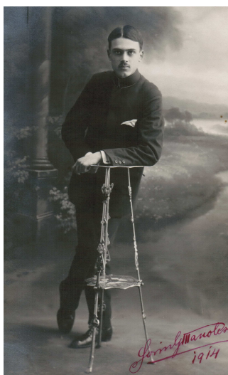
În uniforma Școalei de Comerț din Craiova (1914). Editura Fotografia Artistică M. K. Dudinsky, Craiova.