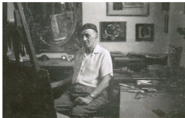
1955 (în atelier).