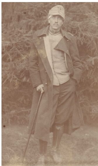
Rănit în luptele de la Turtucaia (23 august 1916)