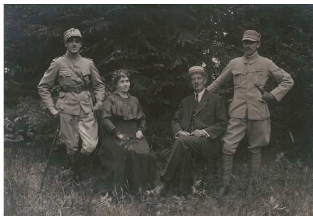
Împreună cu familia la sfârșitul războiului