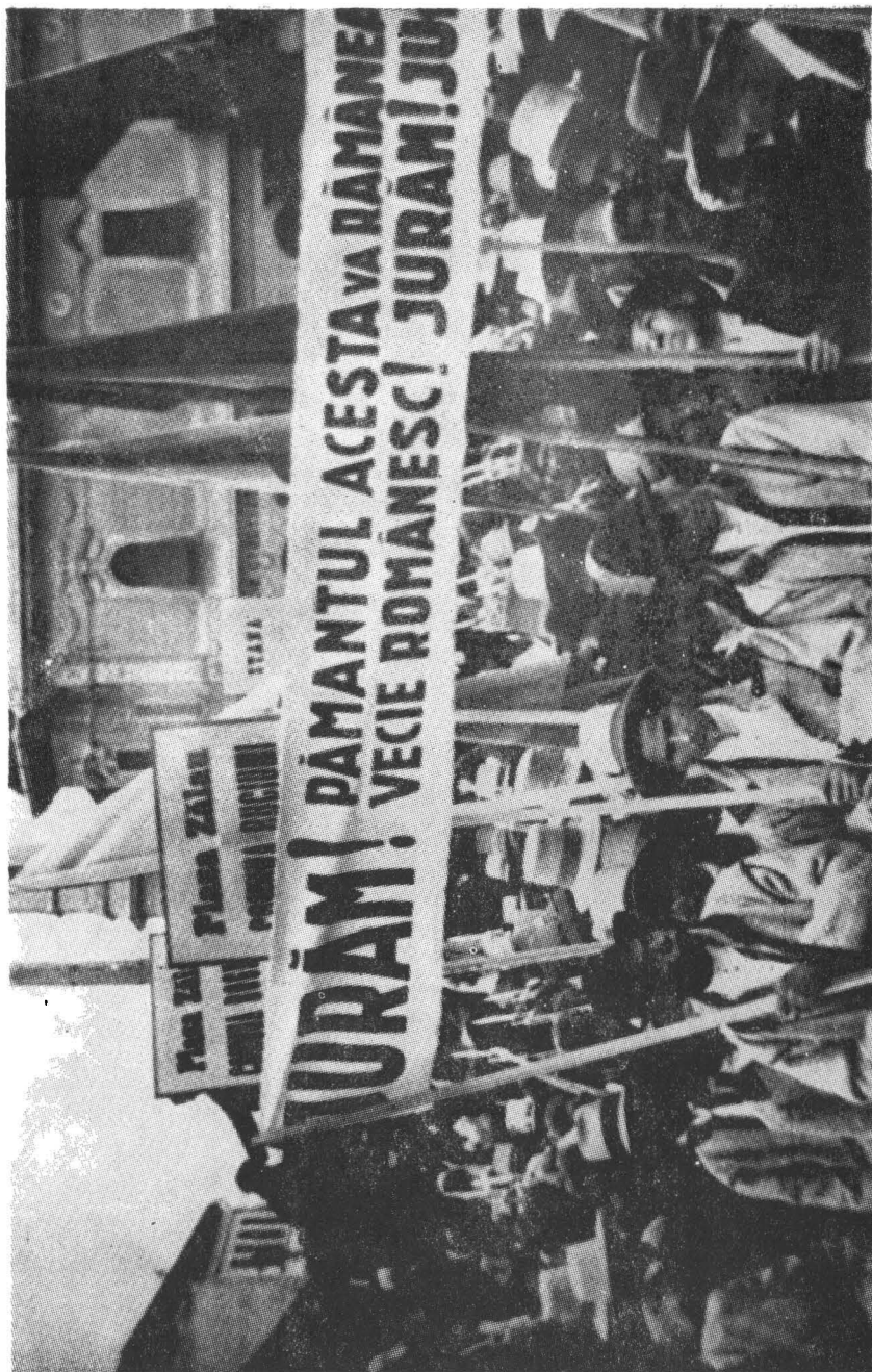
Fig. 2. Detaliu de la Adunarea Populară cu lozinci antirevizioniste.