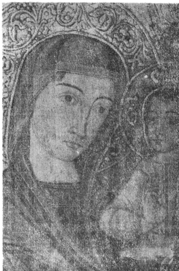
Fig. 4. Biserica de lemn din Dobrin (jud. Sălaj). Maria cu pruncul, icoană împărătească din 1772.