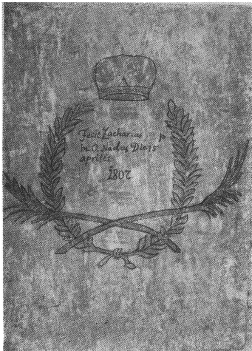
Fig. 7. Inscripție cu numele pictorului Zaharia Pop din Nadiș.