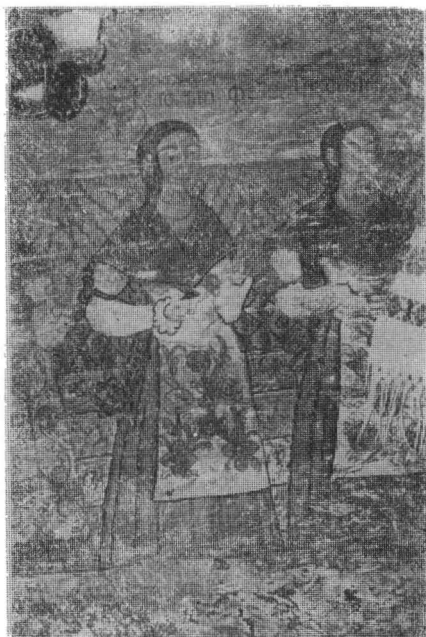
Fig. 5. Chieșd (jud. Sălaj). Pictură murală din pronaos realizată în 1796 de Popa Țiple și Ioan Zugravul din Elciu.