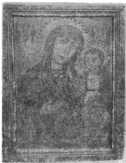
Fig. 6. Chieșd (jud. Sălaj). Icoană pictată în 1807 de Zaharia Pop din Nadiș.