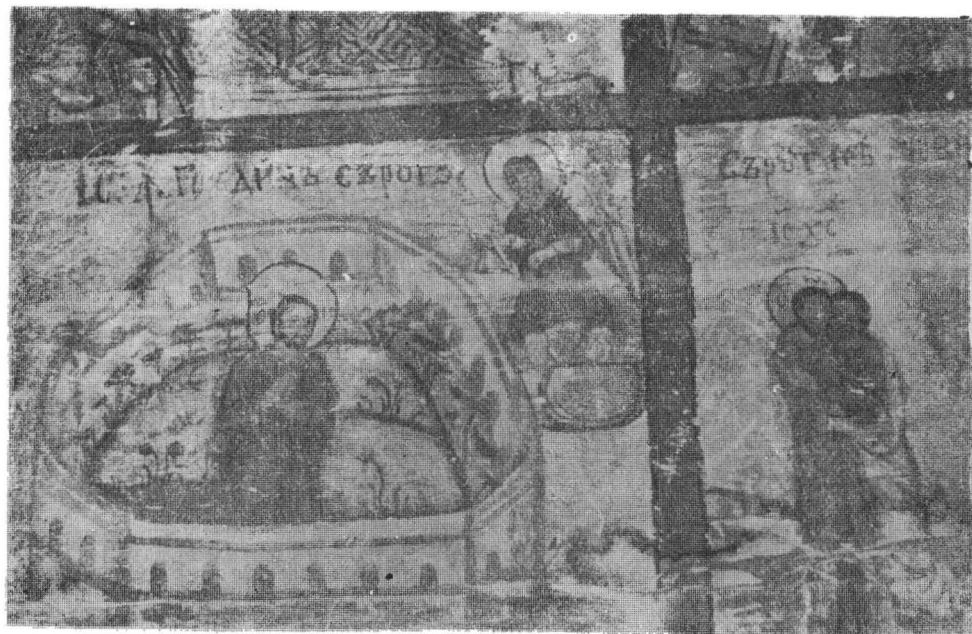
Fig. 3. Biserica de lemn din Dobrin (jud. Sălaj). Detaliu pictură murală de pe bolta naosului.