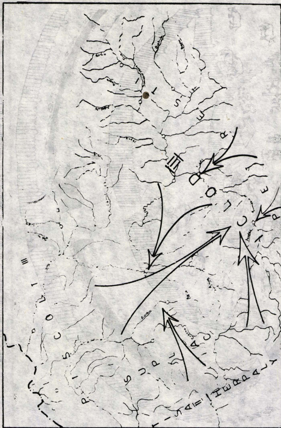
Fig. 1. Harta Bazinului someșan la sfârșitul neoliticului.