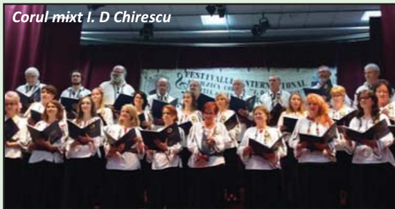
Corul mixt I. D. Chirescu