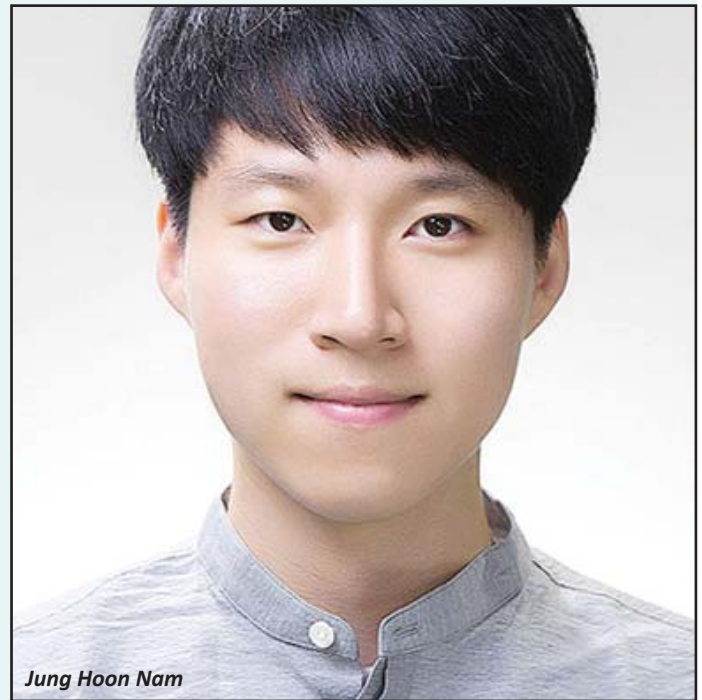
Jung Hoon Nam

concursul a fost câștigat de compozitorul coreean Jung Hoon Nam cu lucrarea Scattering pentru cvartet de coarde. Ambele lucrări vor fi prezentate în primă audiție absolută în cadrul ediției din anul 2010 a Concursului Enescu. Cam târziu!