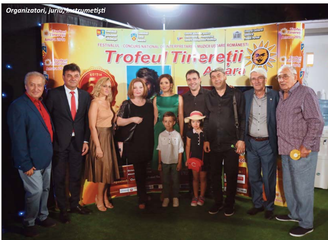
Organizatori, juriu, instrumentiști