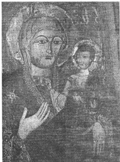
Foto.1. Icoană împărătească. de la Biserica de Lemn din Bunadea, mijlocul sec. al XVIII - lea, Toader Zugrav.