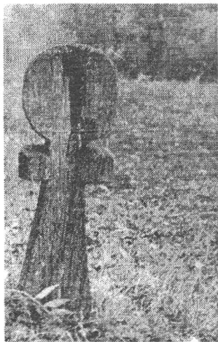
Foto 3. Cruce de mormânt, veche tradiție, de la Deag.