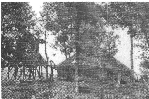
Foto 2. Biserica Buna Vestire din Deag.