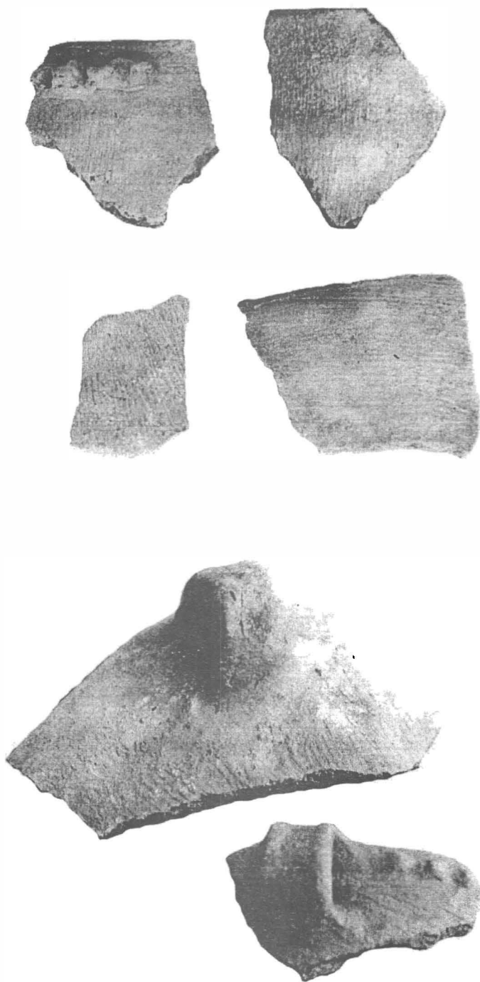
Fig. 1. Costișa-ccramică.