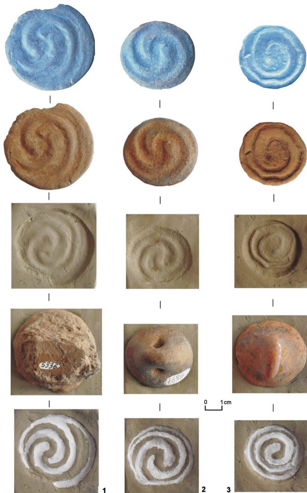
Figura 4 / Figure 4

Păuleni-Ciuc „Dâmbul Cetății”. Pintadere (imagine în negativ, imprimarea, mulajul decorului, decorul rezultat pictat)