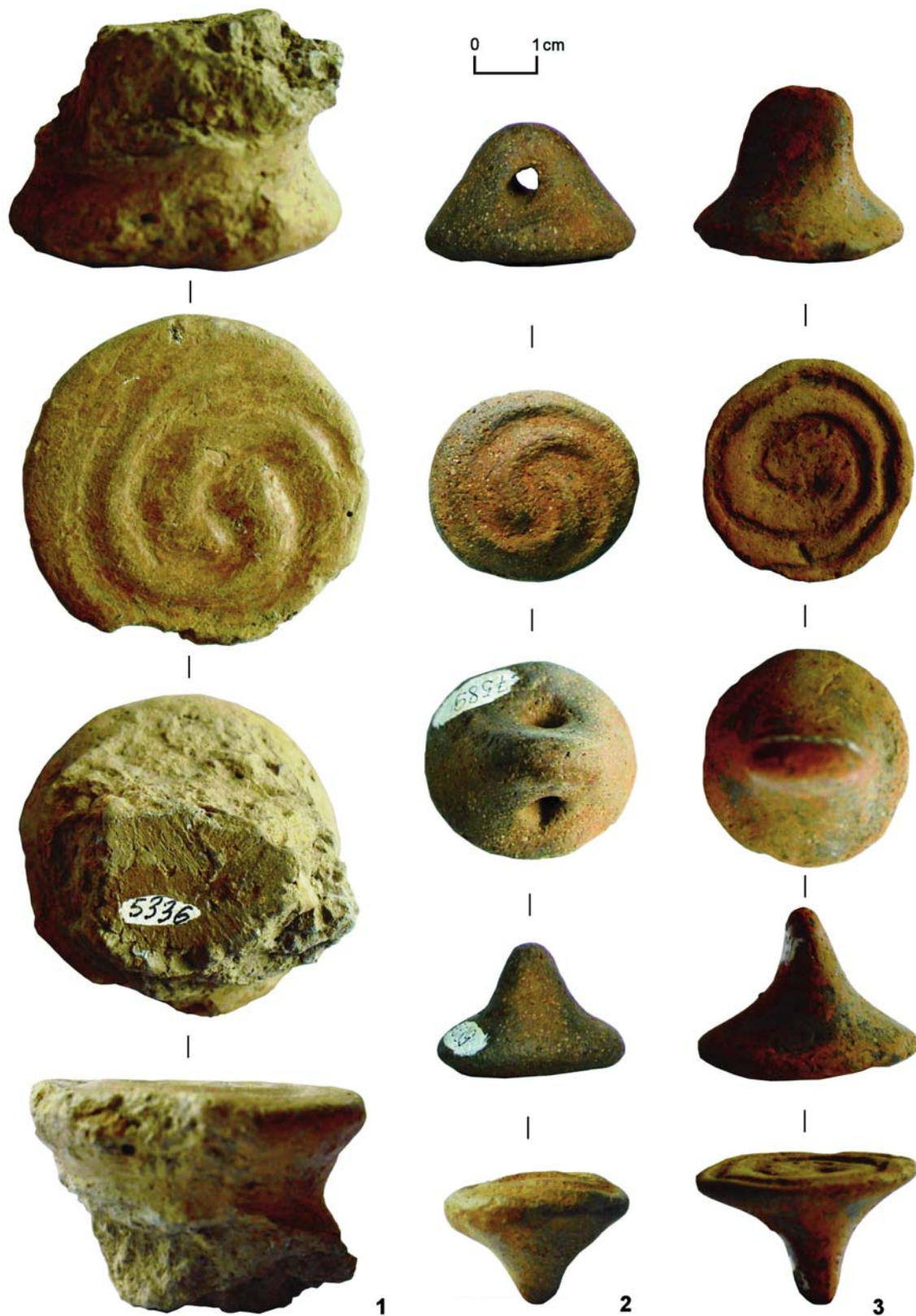
Figura 3 / Figure 3

Păuleni-Ciuc „Dâmbul Cetății”. Pintadere (fotografii)