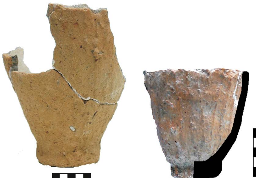
Plasa 1 / Taf 1