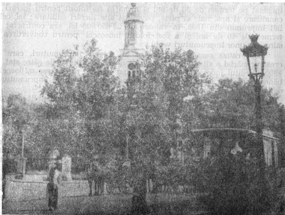
Aspect din Piața Sf. Gheorghe Nou, la sfîrșitul secolului trecut.

muturi : primul în 1881, în valoare de aproape 18 milioane lei. Însă, fiind epuizat, în 1883 a fost contractat un nou împrumut în valoare de 13 200 000 lei cu dobîndă de 5% pe an amortizabilă în 40 de ani. Împrumutul urma să fie folosit pentru convertirea altor împrumuturi mai vechi, precum și pentru stingerea datoriei flotante a primăriei. În 1884 se face un alt împrumut tot la capitaliștii străini, în valoare de 16 000 000 lei. Din el, se rezerva 1,5 milioane pentru construirea de școli. Dobînda la aceste împrumuturi era de 5% pe an, iar amortizarea urma să se facă în 40 ani. Împrumutul era garantat tot cu veniturile provenite din accize. Un nou împrumut extern în valoare de 11.678 000 lei, este contractat în anul 1888 cu dobînda de 4 1/2 pe an. În anul 1890, alt împrumut de 14 000 000 lei apasă pe umerii contribuabililor bucureșteni ; în 1892 un altul de 3 200 000 lei ; în 1893, unul de 750 000 lei, iar în 1894 unul de 5 000 000 și altul de 750 000 lei. Pînă la sfîrșitul secolului, primăria a mai făcut două împrumuturi la un grup de bănci germane avînd ca mijlocitoare banca Marmorosch Blank 6 .