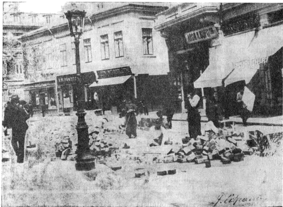
Lucrări de întreținere a pavajului Căii Victoriei (1888).

politice și interese de club. De aici, pe de o parte, numărul mare al primarilor — între anii 1866—1906 au fost în București 23 primari — iar pe de alta, lipsa de stabilitate în administrarea complexă a orașului 2 , ceea ce trădează lipsa de interes a regimului burghezo-moșieresc față de problemele administrației locale, ele reducându-se mai mult la modernizarea centrului orașului locuit, îndeosebi, de clasele dominante. Așa se explică de ce abia la sfârșitul sec. al XIX-lea — între anii 1895—1899 — a fost ridicat, la cererea primăriei, primul plan topografic al Capitalei de către Marele Stat Major al Armatei 3 .