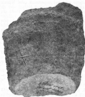
d. Fragmental de vas cu semn incizat.

țare, constituind deci un element în evoluția vaselor de secolul VI către tipurile cu gît proeminent, moment sesizat și la Străulești-Lunca 20 .