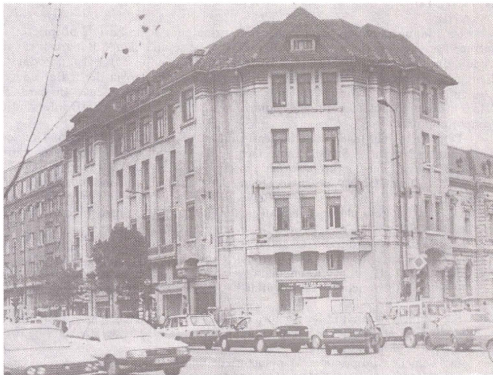
Casa Creditului Funciar Rural – după 1952

De la naționalizare și până în prezent în clădire au funcționat mai multe instituții de stat, printre care și Comitetul de Stat pentru Arhitectură și Construcții (1952–1959) care deținea o bibliotecă de specialitate.