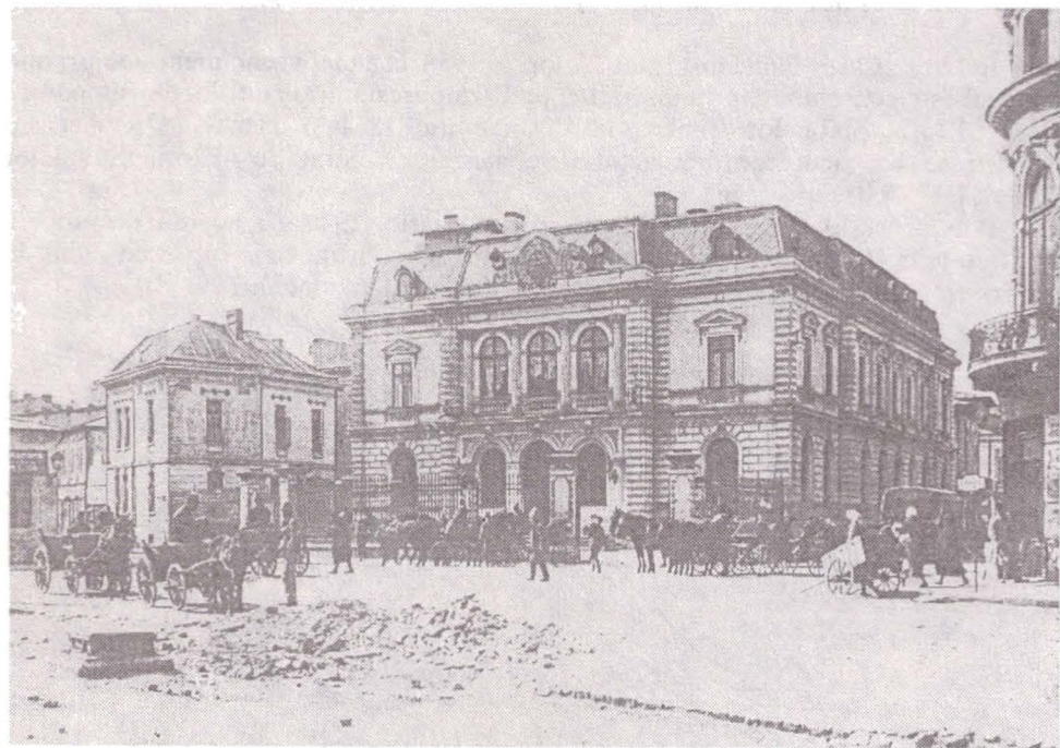
Casa „Creditul Funciar Rural“ – 1925

Imobilul al cărui documentar l-am realizat este al doilea din cadrul complexului de clădiri descrise mai sus. Acesta denumit „Palatul Creditului Funciar Rural“ a suferit transformări în anii 1925 - 1926, efectuate de arhitectul șef al Ministerului de Interne – Paul Smărândescu. 2