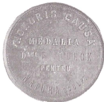
Fig. 1, 2.

Medalii primite de Frederic Storck în perioada studiilor la Școala de Belle Arte din București.