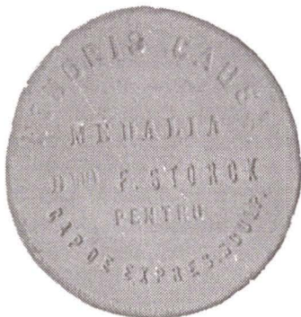
Fig. 3, 4.

Medalie primită de Frederic Storck în perioada studiilor la Școala de Belle Arte din București.