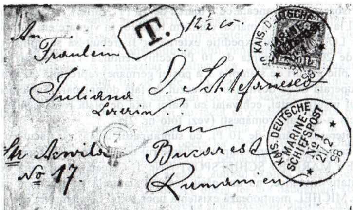
Foto 1. Cu adresa destinatarului.

By its uniqueness, it could be of interest to collectors in Europe or Asia.