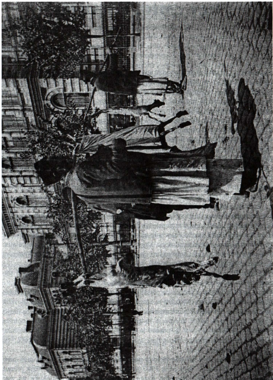
Vânzători de miei; cca. 1930, A. Gh. Ebner