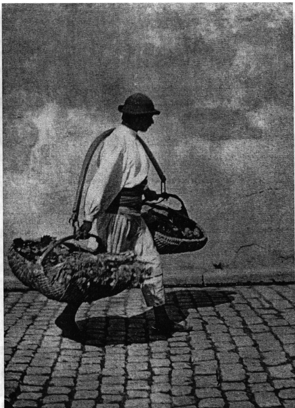
Negustor de zarzavat; 1910