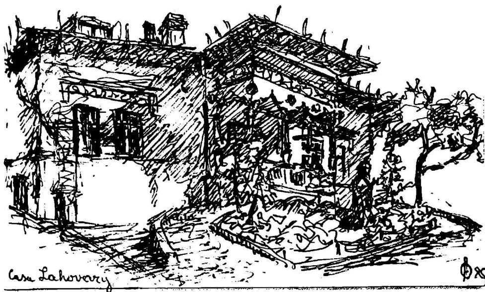
Desen de Alexandru Olian

În 1885, pe atunci colonelul Lahovary, mai târziu general conservator, îl roagă pe arhitectul Mincu să-i facă o casă în stil românesc. Dragostea lui Mincu pentru biserica Stavropoleos, îl face să folosească elemente ale acestui monument pentru Casa Lahovary și „Bufetul” de la Șosea. Pe la sfârșitul anului 1886 casa este gata. Prin ea, a biruit stilul național în arhitectură. Succesul a fost enorm. Lucrarea produce senzație în cercurile