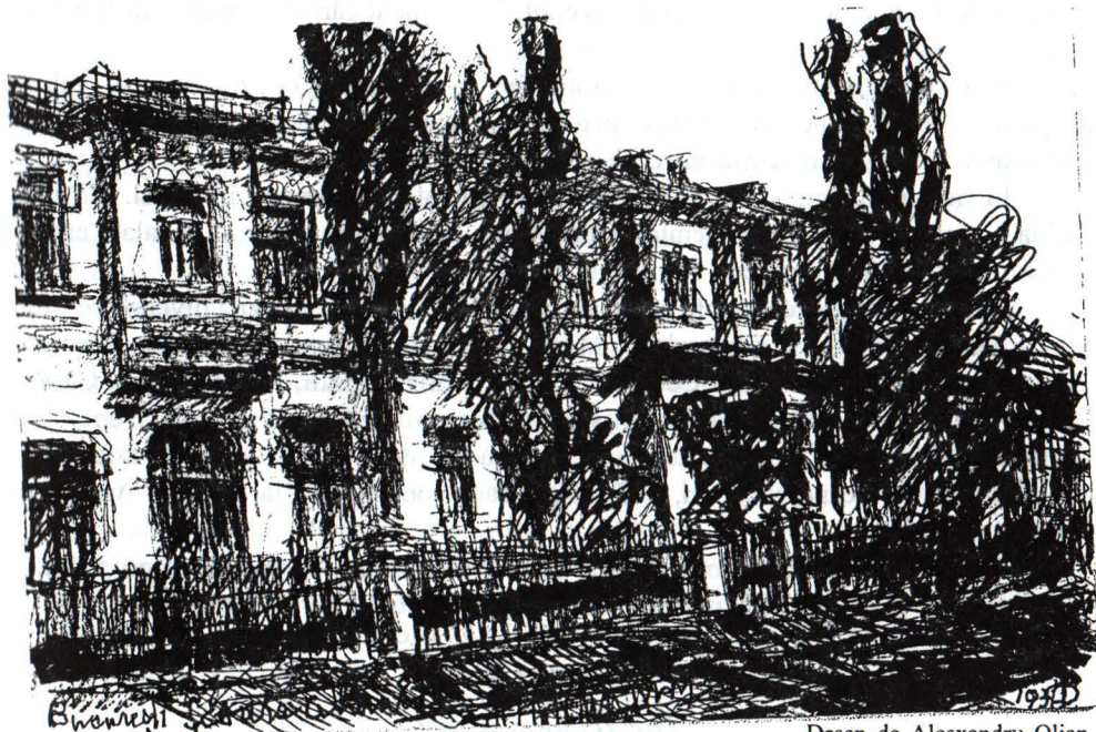
Școala Centrală de fete (arh. Ion Mincu)

De curând s-au împlinit 150 de ani de la înființarea Școlii Centrale, la început „Pensionatul Domnesc de Demoazele” 1851, proiect materializat de domnitorul Barbu Știrbey (1849–1856).