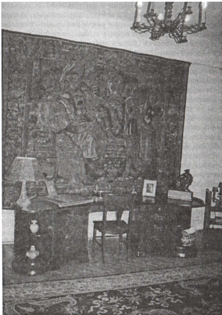
Muzeul „dr. Victor Babeș”

Printre condițiile puse erau și acelea ca „obiectele donate și prevăzute în inventar nu vor fi scoase din imobil fără consimțământul donatorului” 18 , iar „Sfatul Popular al Capitalei intra în proprietatea și folosința bunurilor donate în momentul autentificării prezentului act de donație.” 19