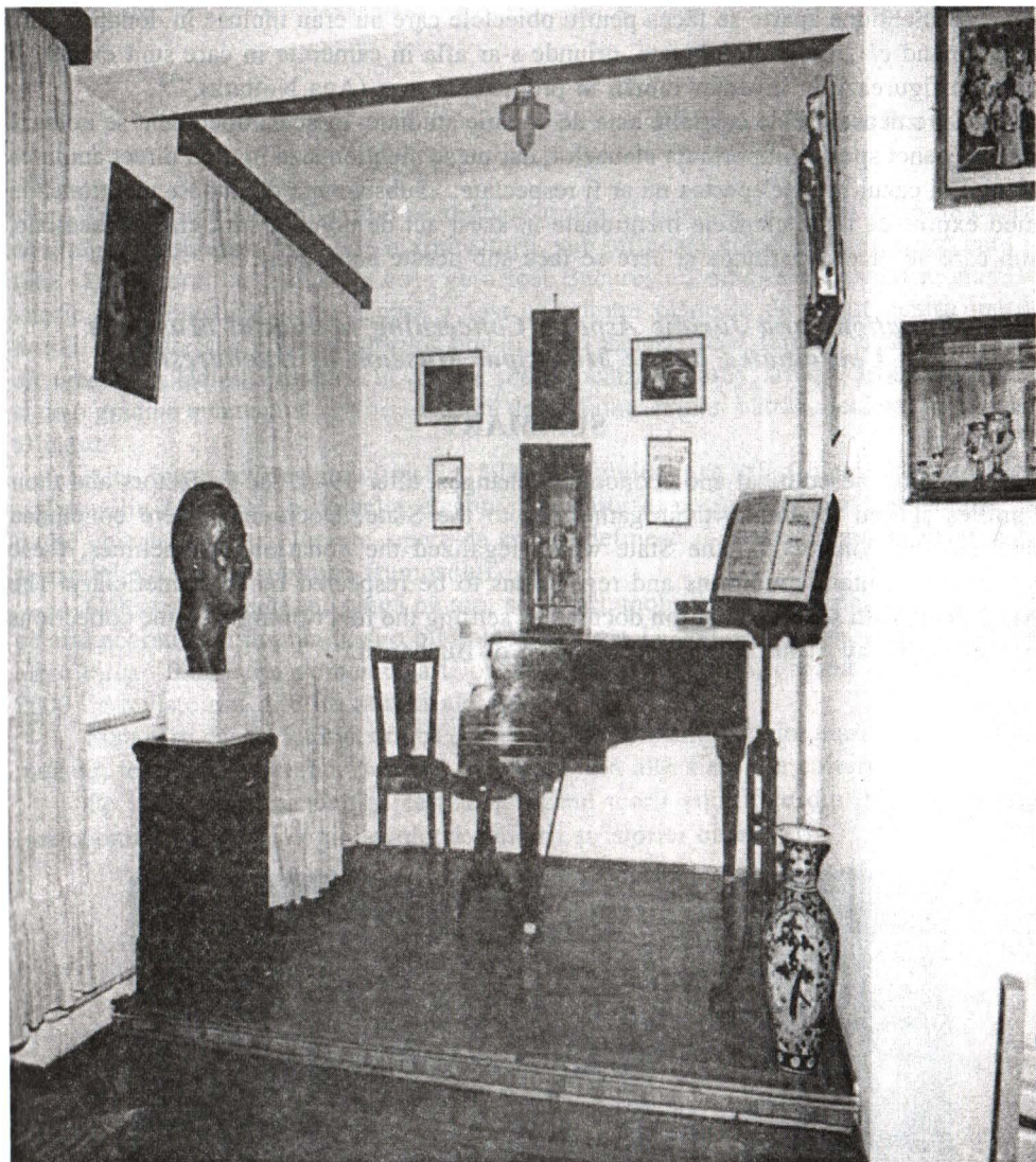
Muzeul „C. I. și C. C. Nottara”