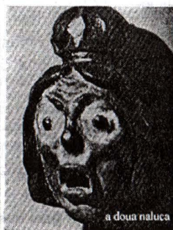
a doua naluca