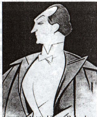
Actorul Tony Bulandra

Cutremurul catastrofal din noaptea de 9-10 noiembrie 1940, cu epicentrul în Vrancea, a produs mari pagube orașului. La cinematograful Carlton, rula, în perioada aceea, filmul „La răscruce de vânturi”, cu Merle Oberon și Lawrence Olivier. Cutremurul s-a produs în timpul nopții, când sala era goală, altfel numărul victimelor ar fi fost mult mai mare. Blocul cu multe etaje s-a transformat într-un morman de moloz amestecat cu trupurile locatarilor surprinși în timpul somnului. Clădirea Teatrului Național a fost și ea avariată.