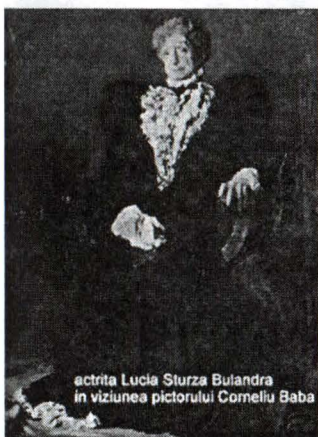
actrița Lucia Sturza Bulandra în viziunea pictorului Corneliu Baba

Cinematografele „Marna” și „Marconi”, de pe Calea Griviței prezentau, în pauze, spectacole de revistă de un gust îndoielnic. Marele actor Al.Giugaru și-a început activitatea în trupa de la Marna. În sălile „Marna”, „Marconi” și „Volta-Buzești” jucau actori din centrul Capitalei, când sălile lor erau distruse de incendii, cutremure sau bombardamente.