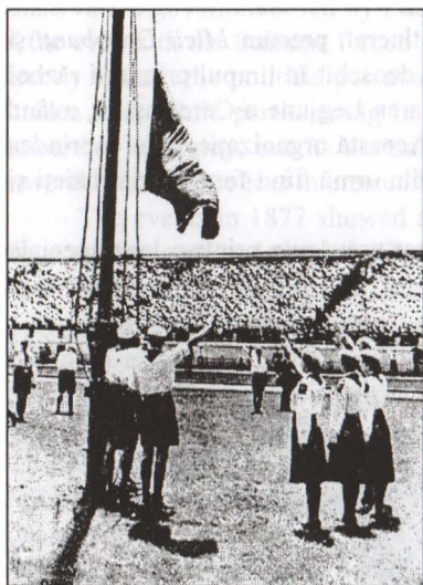
Solemnitatea arborării drapelului

Mișcarea este controlată de către stat și este obligatorie, fiecare tânăr fiind încurajat să-și dezvolte energiile și talentul în conformitate cu propriile preferințe și cu propriul temperament.