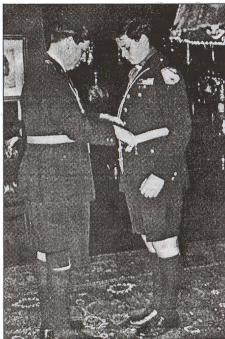
Regele Carol al II-lea și Mihai în uniforme de străjeri

Oficialilor de stat li se acordă timp special, ca să poată fi prezenți la aceste cursuri sau manifestări.