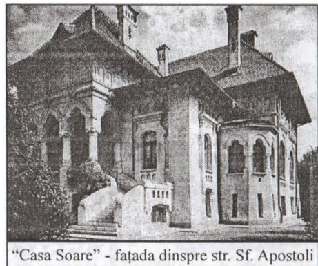
“Casa Soare” - fațada dinspre str. Sf. Apostoli

În jurul holului central de la parter erau dispuse vestibulul, biblioteca, salonul, salonașul, sufrageria cu oficiile anexe, precum și dormitoarele părinților și cele ale copiilor, cu încăperile de toaletă.