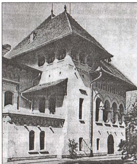
“Casa Soare” - fațada dinspre str. col. Poenaru-Bordea

Clădirea, cu destinație mixtă – locuință și sediu de întreprindere particulară, a fost înălțată pe un teren de 3012 m.p. în formă aproape pătrată, astfel încât fiecare dintre laturile sale să poată constitui câte o fațadă deschisă spre străzile Apolodor, Col. Poenaru Bordea și Sf.