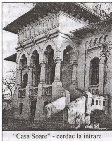
“Casa Soare” - cerdac la intrare

La etaj se aflau alte săli de studiu pentru copii, dormitoare pentru musafiri, camere destinate personalului de serviciu și anexe.