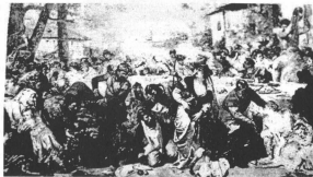
Boieri surprinși la ospăț de Vlad Țepeș, pictură de Th. Aman

„Descriptio Moldaviae” (1716), drept „norma de a judeca drept în Moldova”. De fapt, el a slujit nu numai în Moldova, dar și dincoace de Milcov, în Țara Românească, deoarece o bună parte a lui a intrat în alcătuirea celui de-al doilea codice al lui Matei Basarab (1632-1654). Acest de-al doilea codice, purtând titlul de „Îndreptarea legii”, a apărut la Târgoviște în 20 martie 1652, fiind prima operă juridică din Țara Românească cu pronunțat caracter laic și cea mai cuprinzătoare legiuire tipărită în limba română în tot cuprinsul evului mediu. Totuși, „Îndreptarea legii” avea un caracter de clasă; pe lângă prevederile îndreptate împotriva țăranilor, ea făcea o discriminare netă între boieri – numiți „boiaren de treabă și de folos”, „cei cu rudă bună”, „mai marii altora” etc – și țăranii considerați „cei mici și proști”, „țărani de cei neînțelegători”, „plugari” etc.