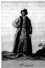
Boier din Țara Românească, litografie, sec. XIX