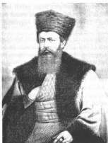
Constantin Moruzi (1777-1782), un portret din Muzeul Societății Istorice și Etnologice din Atena