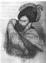
Ioan Vodă cel Cumplit (1572-1574), stampă, sec. XIX

Fapte deosebite, cu urmări tragice, s-au întâmplat și în timpul domniei lui Ioan Vodă (1572-1574) zis și cel Cumplit. După biruința de la Jiliștea, Ioan vodă a trimis pe un pretendent, pe Vintilă fiul lui Pătrașcu cel Bun (1554-1557), să ocupe Bucureștii și să se facă domn. Încercarea reuși, dar după patru zile, Alexandru vodă Mircea, cu ajutor turcesc își restabilește domnia, îl surprinde pe noul domn și-l ucide. Capul lui a fost ținut de poarta Curții domnești din București.