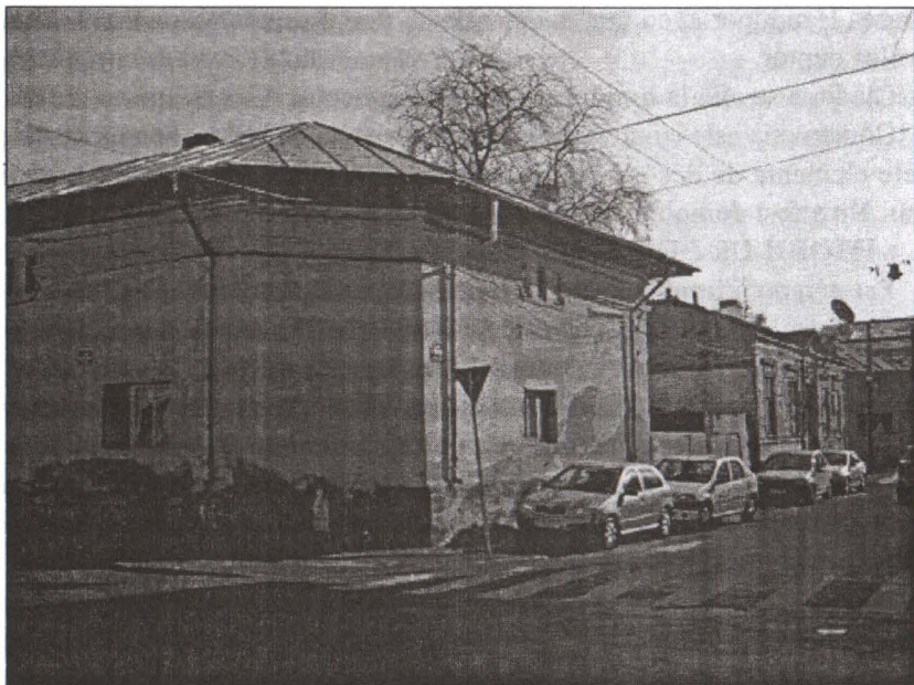
Calea Rahovei nr.77/93/79 colț cu Strada Libertății/Gladiolelor

Prund cu privire la construirea unei case în Calea Rahovei nr. 79 colț cu Str. Libertății. Fila I. conține o cerere din 12 ian. 1912 Primăria Capitalei nr. 00839. Dorind a construi pe proprietatea Epitropiei din str. Rahova nr. 79 colț cu Libertatei vă rog a-mi elibera autorizațiunea necesară. Construcțiunile ce voesc a face sunt: un corp de clădire cuprinzând o simigerie și măcelărie cu dependențele lor după planurile anexarte, precum și 10 metri liniari împrejmuire de lemn cu șipci în str. Libertatei. Planul clădirilor arh. I. Vulcan. Semnat epitropi N. Săbăreanu și al doilea indescifrabil.