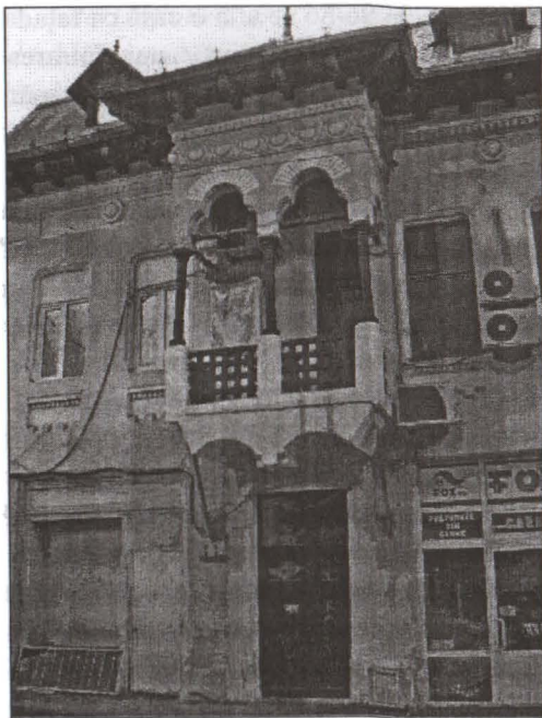
Fațadă Calea Rahovei nr.42/96/86 (foto. C. Ene)

dosar. Comisarul secțiunii, I. Vasilescu notează pe verso să se dea curs lucrării pt. că autorizațiunea a perduto.