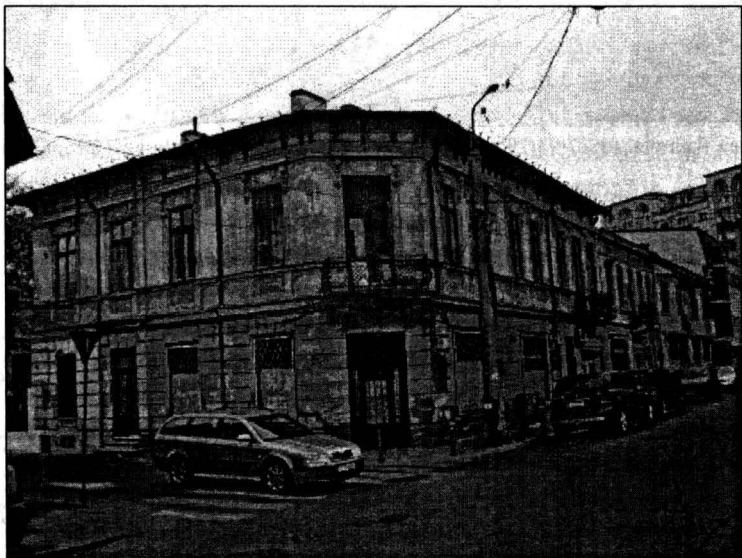
Calea Rahovei nr.79/95/81 colț cu Strada Libertății/Gladiolelor