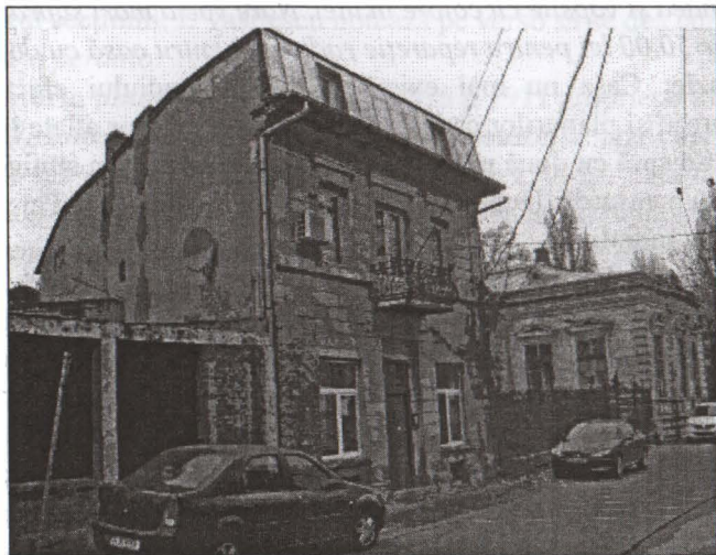
Calea Rahovei colț cu Strada Justiției, teren viran pe locul casei Nicolae Christu nr. 22/74/64; încercare construcție nouă. În linie cu casa Faschang de la nr. 20

Imobilul a fost ridicat la colțul străzii Calea Rahovei cu Justiției. Casă cu funcțiune mixtă - prăvălie+locuință conform Dosarelor PMB.