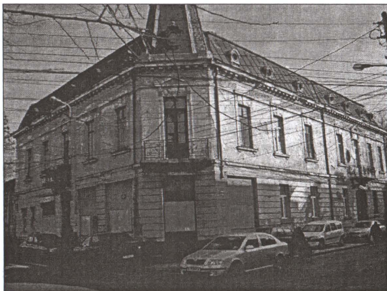
Calea Rahovei nr.17/71/53 colț cu Strada Justiției

Proprietari : Dr. D. Valentineanu. Dosar 33/1888 - La Fila 141 este cererea nr. 11754/1888. Fila 142 Autorisațiunea nr. 77 din 21 apr 1888 a repara radical casa . Colț cu Justiției „La casele mele din Calea Rahovei nr. 71 având trebuia a schimba fierul (tabla) învelitoarei fără a atinge căpriori reala sau altă lemnărie, a face o mică reparație unui colțu de zid și a le tencui cum și a schimba în curte scara de piatră, antreul și marchiza. Am onoare a vă ruga a elibera cuvenita autorisațiune”. 46