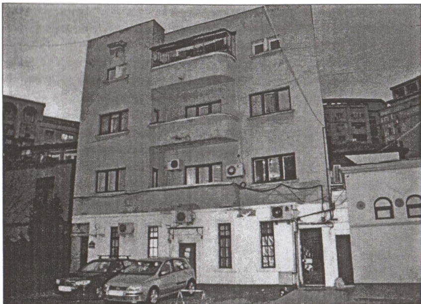
Vila Petre Hanciu