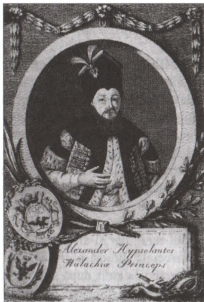
Alexandru Ipsilanti, inițiatorul primelor măsuri cu caracter edilitar privind Bucureștiul

În timp de războaie sau răscoale, ordinea și paza erau asigurate de carauale alcătuite din cincisprezece străjeri, a căror misiune era aceea de a străbate ulițele și mahalalele orașului.