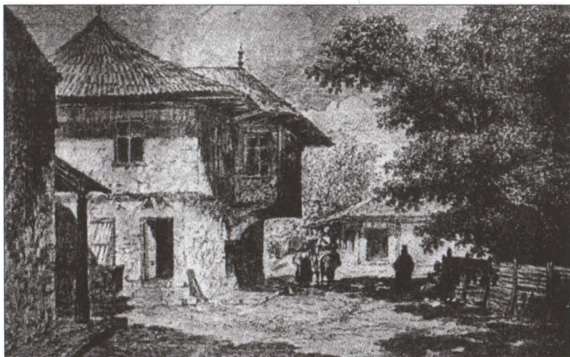
Uliță în București la sfârșitul secolului al XVIII-lea

Fără îndoială că într-o perioadă în care administrația orașului se afla în plin proces de reformare, iar legea era aplicată după bunul plac al autorităților, au existat și numeroase abuzuri. Ne referim în special la excesele agiei, adică ale poliției. Aceasta a exersat un regim de teroare în vremea lui Costache Chihai, poreclit „chiorul”, cum nu a existat până atunci. Doar zvonul că pe ulițele Bucureștiului urma să-și facă apariția Costache Chiorul producea o reacție de groază. Timp de peste două decenii cât a fost în slujba agiei, trezea spaima atât în rândul oamenilor cinstiți, din cauza caracterului său samavolnic și hrăpăreț, cât și în rândul borfașilor, tâlharilor și vagabonzilor.