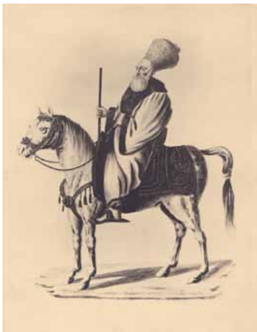
Fig. 2. Boier român, fotocopie, patrimoniul MMB.