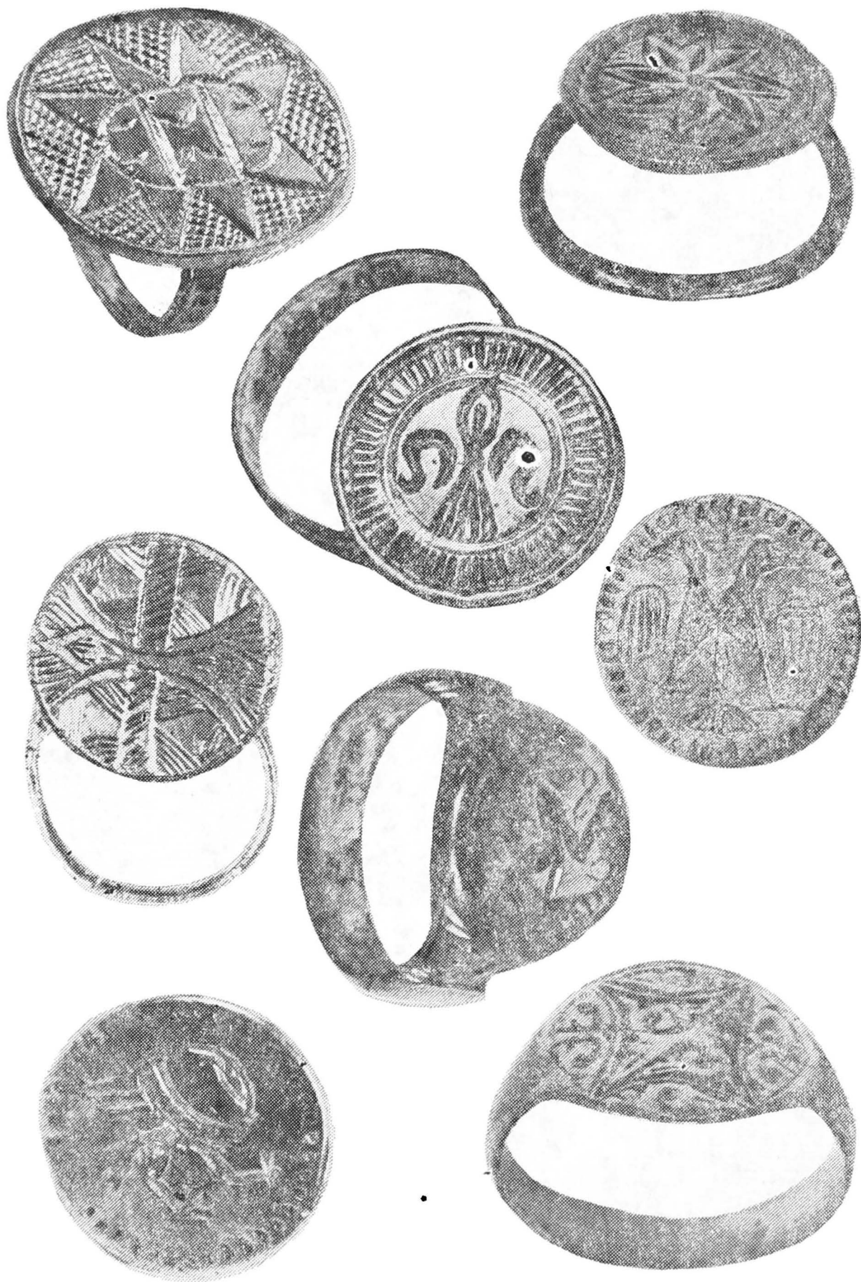
Pl. IV, Inele de argint din secolele XIV—XV descoperite în necropola 2 a satului Mănești.