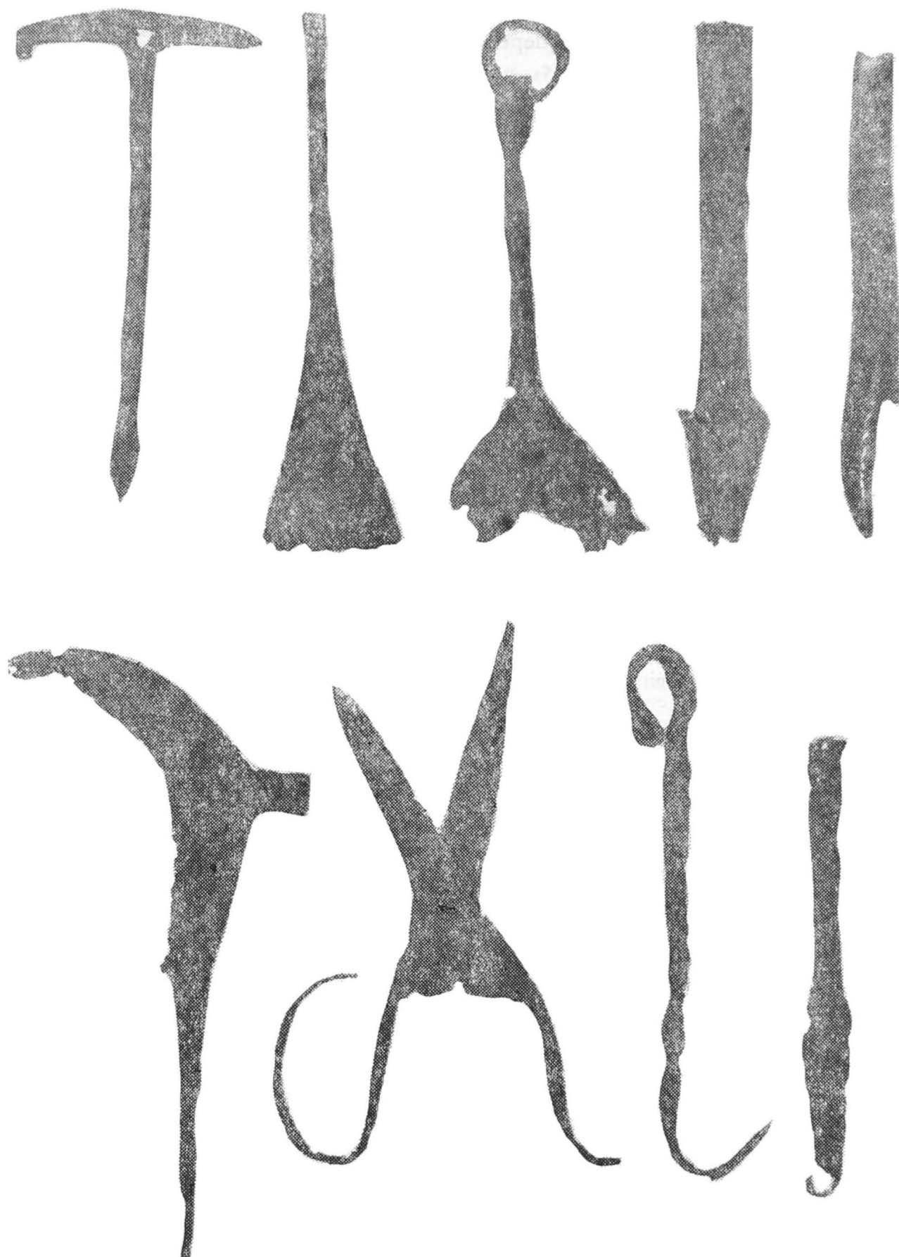
Pl. I, Unelte din fier descoperite la Măicănești (1, 3—4, 6—7, 9) și Mănești (2, 8); undrea din os de la Măicănești (5).