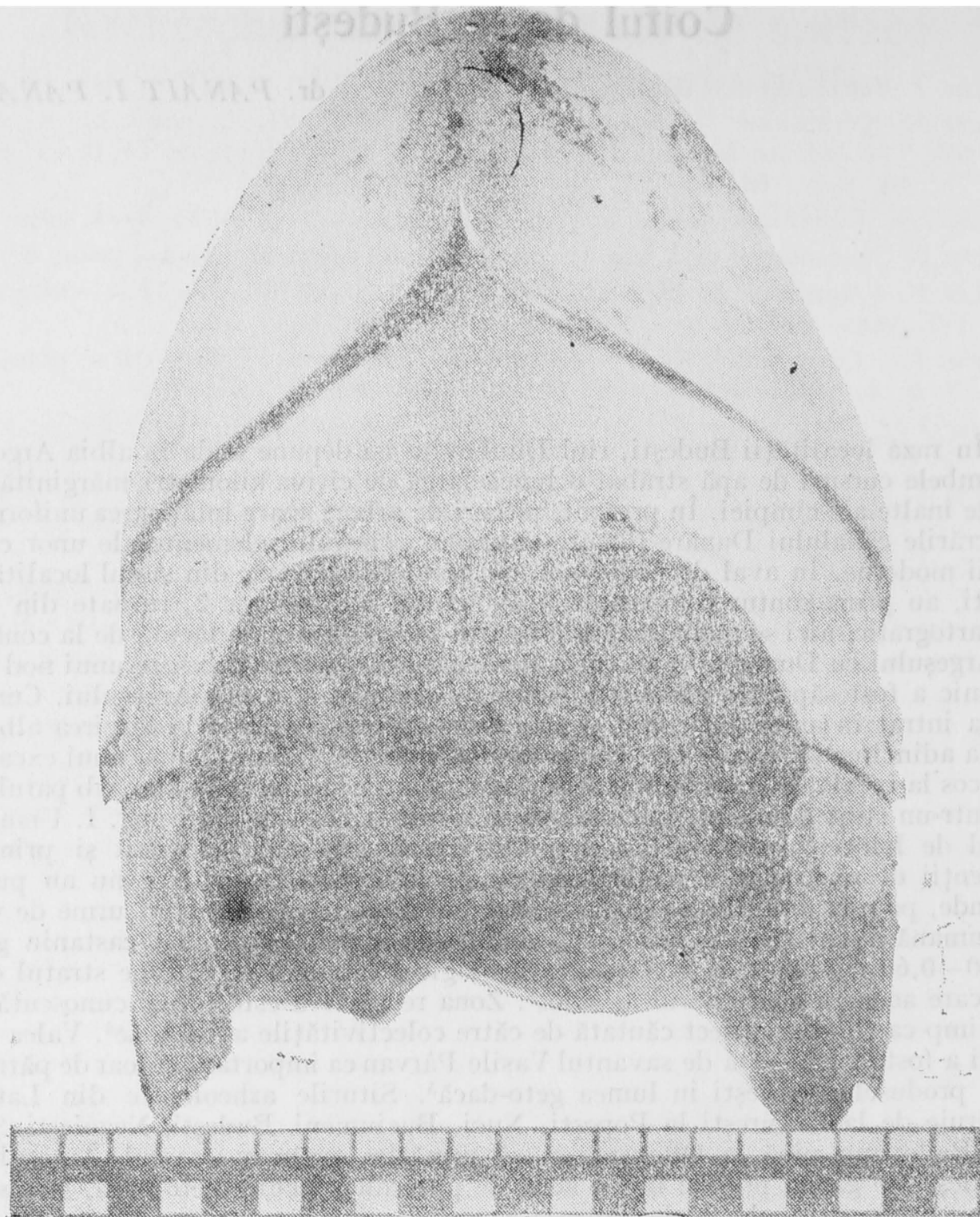
Fig. 1. Coiful de la Budești, secolele IV—III î.e.n. Vedere din față.

de apărătoarea de nas și lăcașurile pentru urechi. Tot din această parte pornește apărătoarea de ceafă, cu care face corp comun. Este de fapt partea cea mai puternică a coifului. Foaia de bronz își păstrează grosimea inițială, căpătînd chiar unele îngroșări. Golurile oculare, de exemplu, poartă cîte o muchie, o sprînceană, care dublează grosimea tablei. Aceste muchii pornesc mai înguste, se lățesc spre curbura maximă, pentru a se contopi cu apărătoarea de nas. Nici calota și nici porțiunea de bază nu au motive decorative. Apărătoarea de nas este scurtă de 2 cm și lată de 1,2 cm; puternic îngroșată și împinsă de la vîrf spre exterior. Lăcașele pentru urechi sînt rotunjite (cu diametrele de 4 și respectiv 4,5 cm), cu marginile trase spre ceafă (Fig. 2). Din căderea lor se formează apărătoarea de ceafă, lată de 6,5