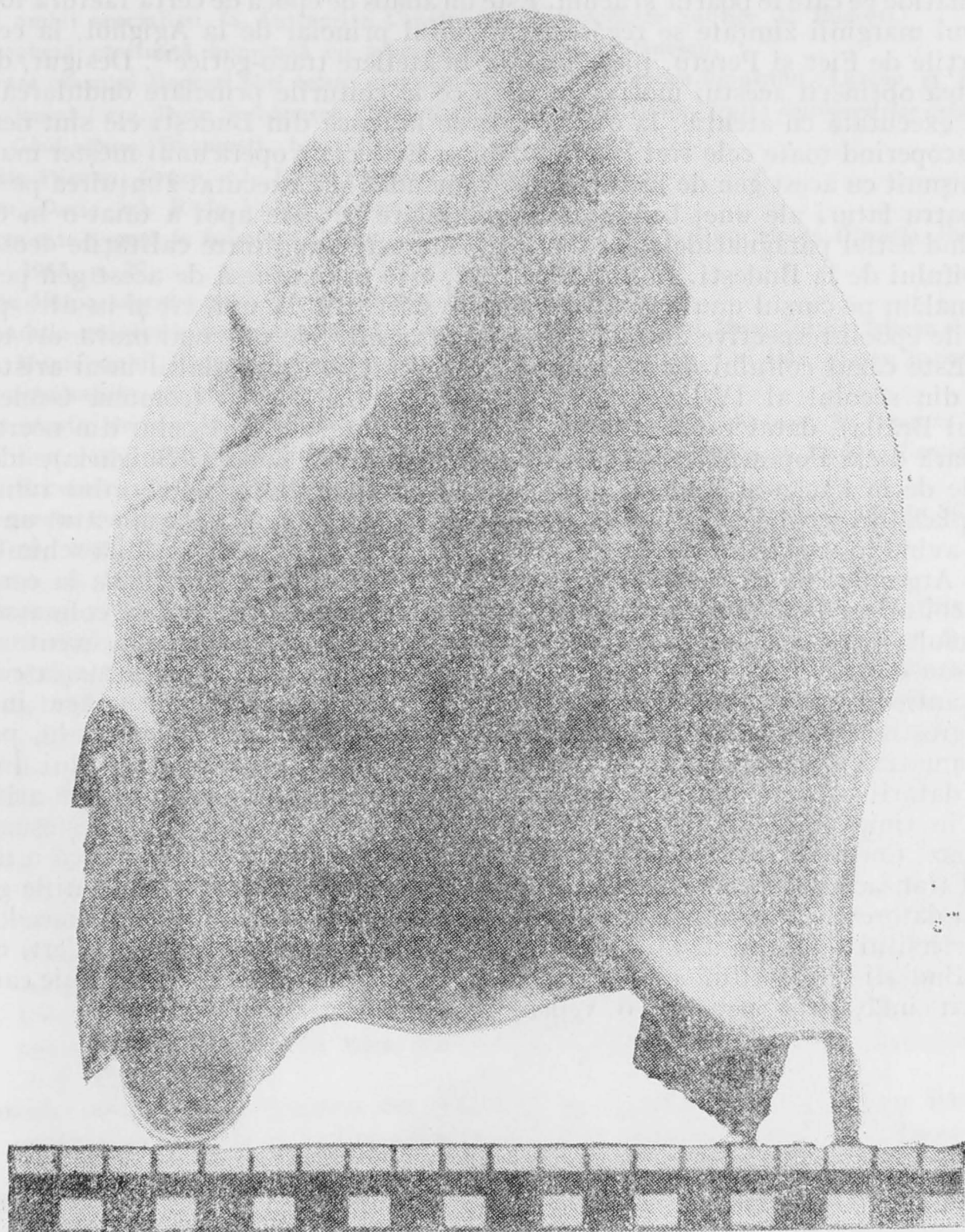
Fig. 4. Coiful de la Budești. Vedere din spate cu apărătoarea de ceafă.

Coiful de la Budești este extrem de sărac în motive decorative, deși forma sa este elegantă. El s-a păstrat intact, așa cum l-a purtat ultimul posesor. Din nefericire, cupa excavatorului i-a spart calota în lobul stîng, pe care l-a sfîșiat din creștet pînă aproape de ureche 8 . Alte mici perforații apar spre creastă, unele fiind făcute din vechime. După petele din interior rezultă că a fost căptușit cu piele.