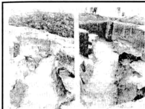
Fig. 32. Șanțul de apărare de la Cârcea Viaduct, SC III B, după M. Nica

Cele mai timpurii fortificații neolitice apar încă de la sfârșitul neoliticului timpuriu, odată cu chalcoliticul balcano-anatolian (CBA Lazarovici 1987-1988; 1993; Lazarovici - Nica 1991). Unele dintre situri sunt fortificate cu șanț și uneori palisadă (Marinescu, 1969). Valuri nu au fost descoperite, așa încât putem presupune că lutul rezultat a fost folosit la construcția locuințelor și a diferitor instalații interioare, fie pentru modelarea ceramicii.