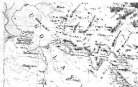
Fig. 35. Clisura Dunării.