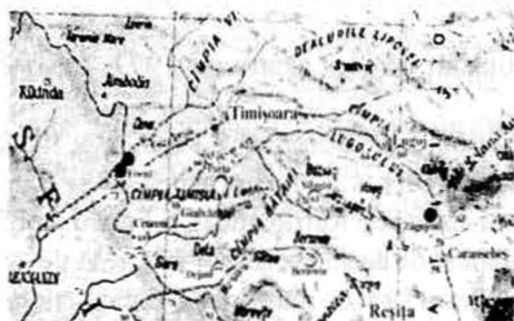
Fig. 34. Centrul Banatului, Valea Timișului și Bârzavei.

Indiferent dacă erau locuințe adâncite sau de suprafață, majoritatea caselor erau dotate cu instalații de foc, mai simple sau mai complexe, instalații absolut necesare într-o zonă de climă temperată, cu ierni destul de aspre. În unele cazuri s-au păstrat și urmele unor amenajări interioare, de tipul lavetelor. Probabil că urmele unei mari