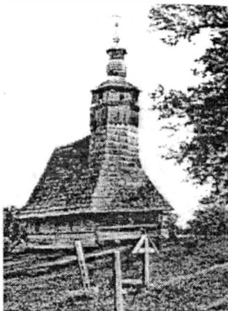
Vidra 1724 (după C. Petranu)