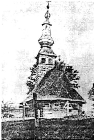
Țohești 1776 (după C. Petranu)