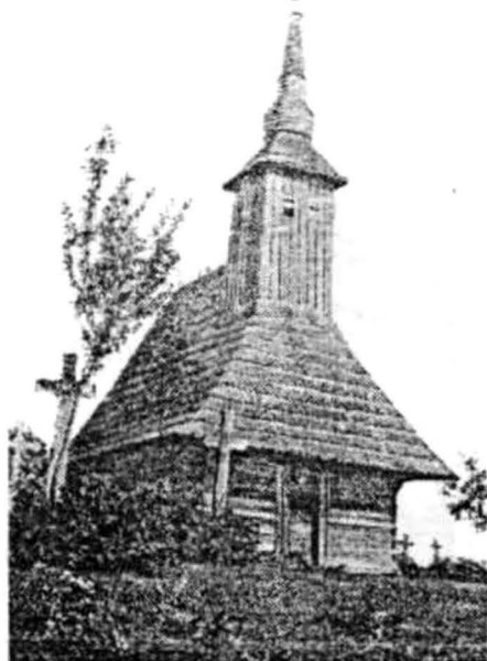
Groșeni 1724 (după C. Petranu)