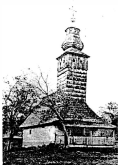
Rostoci 1762 (după C. Petranu)