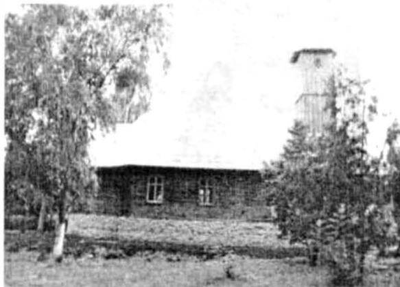
Pl. IV. Etape în distrugerea și recuperarea bisericii din Groșeni: a,b. biserica în curs de demolare, imagine exterioară și iconostasul; c,d. biserica mutată în incinta Spitalului Județean din Arad, completată cu părțile lipsă din zona occidentală.