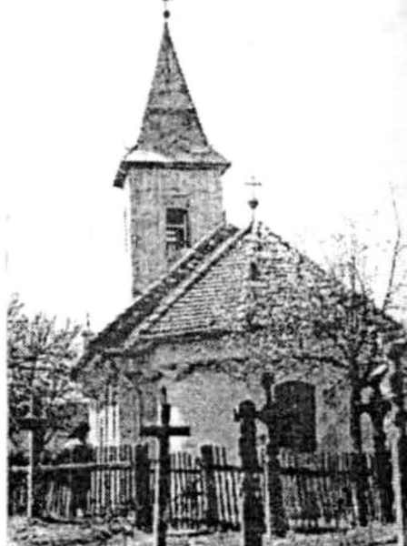
Groșeni 1724 (după reparația din 1930)

Pl. II. Biserici de lemn din zona Aradului (după P. Vesa, op. cit.). Se observă continuarea unor tipologii mai vechi și tendința de adoptare a unor elemente de nouitate stilistică, în general de factură barocă. Imaginile bisericii din Groșeni surprind etapa inițială și transformările suferite în 1930.