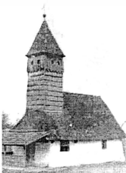
Rostoci 1762 (înainte de demolare)

Pl. 1. Biserici de lemn din zona Aradului (după P. Vesa, op. cit.). Se observă continuarea unor tipologii mai vechi și tendința de adoptare a unor elemente de noutate stilistică, în general de factură barocă.