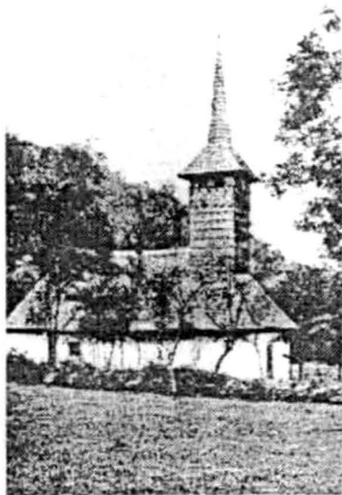
Sârbi 1762 (după C. Petranu)