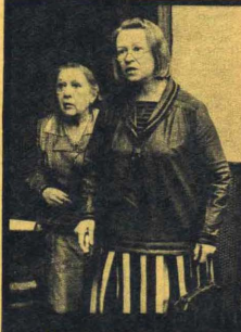
Doză bunișice la la Mannix