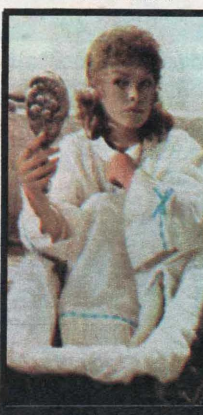
Glenda Jackson într-un rol pe măsura talentului ei atotputernic: Sarah Bernhardt, artista care ducea fantezia pînă la «vînta moartea, jucîndu-se orgolioasă în propriu-i scieru...

ție cu Glenda Jackson scap de afiaș. Actrița nu și-a pierdut însă — ca să spunem așa — capul și ălbăle în temerii rigurose: «Nu cred că există un singur actor în lume care să presupună că a fost perfect într-unul din rolurile sale. Nici un artist adevărat nu e mulțumit vreodată de ceea ce realizează și ceea ce-i însoțește născut este speranța perfecționării... Dar orice i s-a întâmplat, actorul trebuie să evite cu orice preț a se lăsa învin de indiferență. Acesta i-ar fi condamnarea la moarte...»