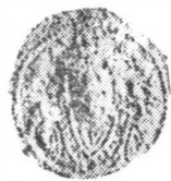
Pl. VIII. Monede bizantine din tezaurul de la Horgești http://www.cimec.ro / http://cmiabc.ro