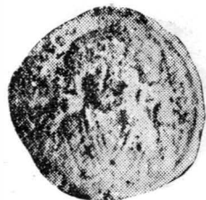
Pl. IV. Monede bizantine din tezaurul de la Horghești