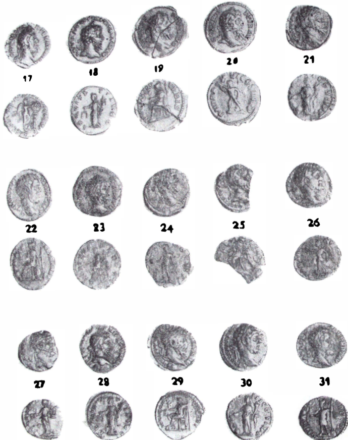
Fig. 2. — Tezaurul de denari imperiali romani de la Blăgești (17-31) Fig. 2. — The Hoard of Roman Imperial denarii from Blăgești (17-31).