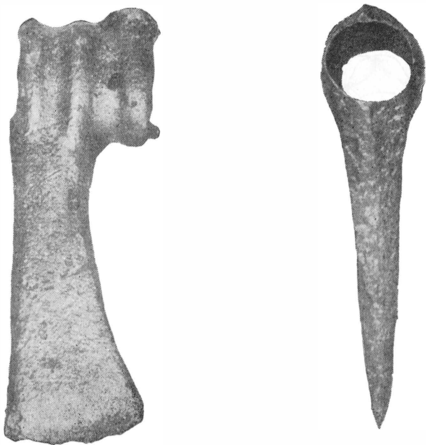
Fig. 3. — Toporul de la Mileștii de Sîs (foto).