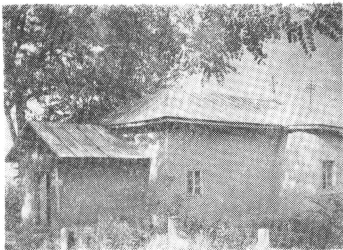
Fig. 1. a. Biserica de lemn din Fichitești — Podu Turcului, jud. Bacău (vedere din sud-vest).