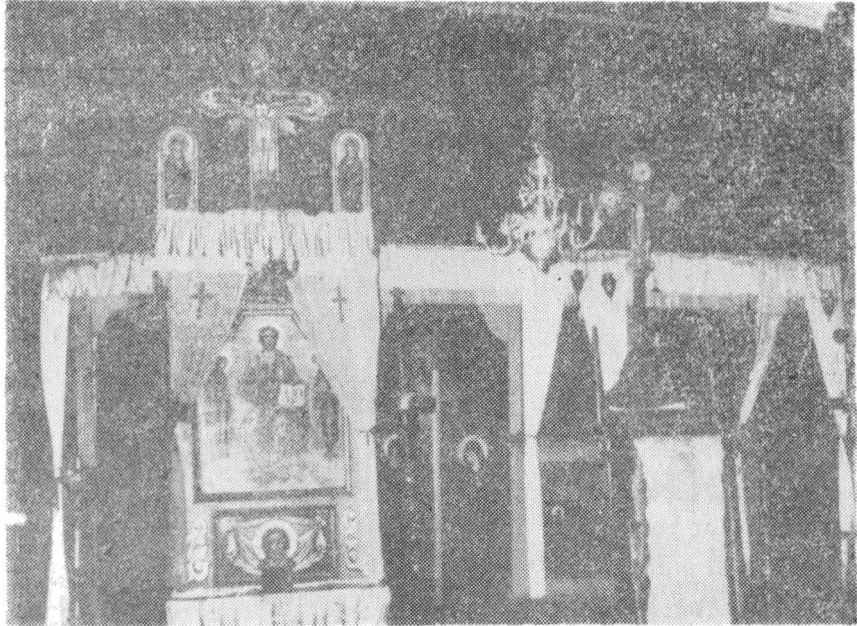
Fig. 2. a. Catapeteasma bisericii din Fichitești — Podu Turcului, jud. Bacău.