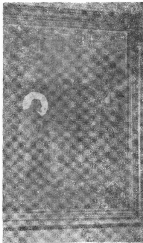
Fig. 4. Icoane de lemn din biserica de la Fichitești — Podu Turcului jud. Bacău.