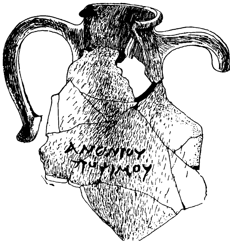
Fig. 2 Amforă cu inscripție (tituli picti).