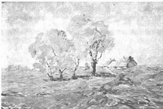
Iosef Steurer Toamna

O zi rece de iarnă, cu scânteierea griurilor sensibile ale zăpezii, peisaje dominate de abundența vegetală a verii, tonică, de un verde răcoros, tonalitățile solare ale toamnei, ori evocarea toamnălor târzii