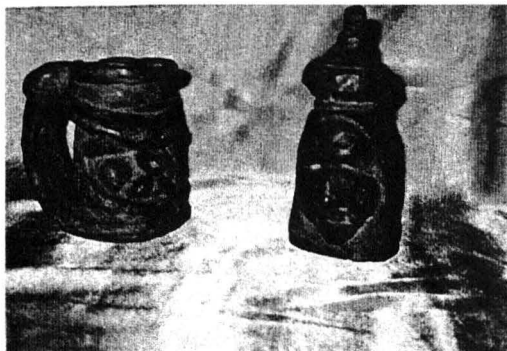
Iosef Steurer Sculptură mică

Din punct de vedere al realizării tehnice, obiectele sunt lucrate prin modelare din pământ și lut ars, unele purtând semnătura autorului ori data