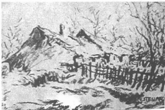
Iosef Steurer Casă la țară

Elementele peisajului sunt tratate sintetic într-o construcție