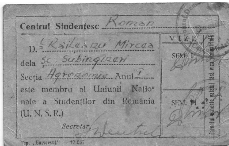
DOC. 1 (verso)