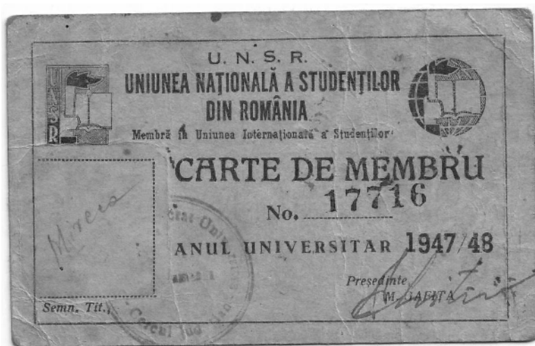
DOC. 1 (față)