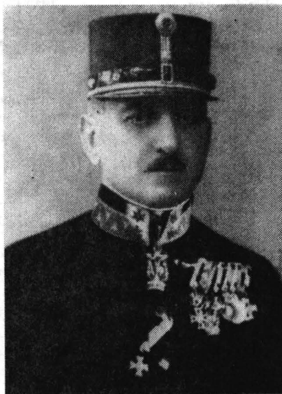
Popovici Konstantin alezredes (Hofmann - Hubka nyomán)