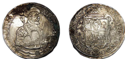
4 (inv. 3861)