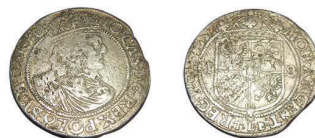
6 (inv. 3453)