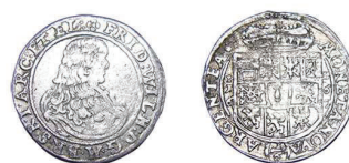
11 (inv. 3822)