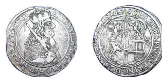
9 (inv. 3820)