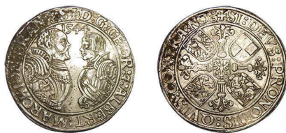
3 (inv. 3845)