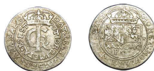
7 (inv. 3780)