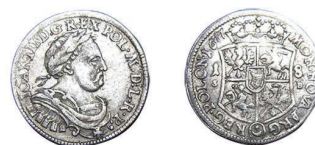
8 (inv. 3813)