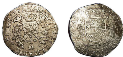
1 (inv. 3843)