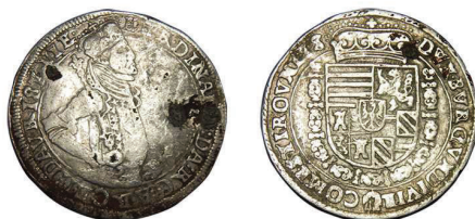
5 (inv. 3851)