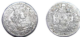
10 (inv. 3827)