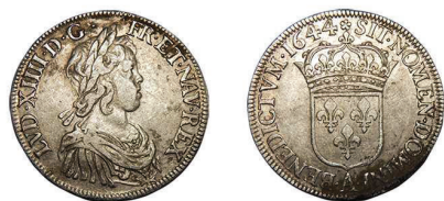
2 (inv. 3860)