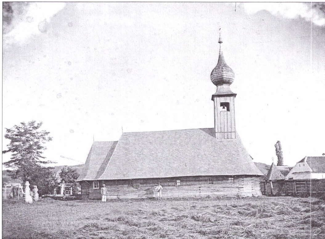
Fig.1. Biserica de lemn din Bistrița la 1895.