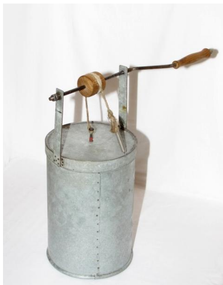
Foto. 2. Buhaiul din tablă, cu manivelă (colecția personală de instrumente Ovidiu Papană)

Pentru buhai, rezultatul final al acestei stări de fapt a fost apariția unui instrument muzical cu rol de substitut – buhaiul cu manivelă, construit din tablă. El reprezenta oglinda fidelă a acelor vremuri în care arhaicul se „încăpățâna” să reziste provocărilor de moment. În același timp, noua construcție muzicală se dovedea a fi varianta ingenioasă prin care omul de rând de la țară, convertit să practice activități de factură industrială a construit o replică acceptabilă a unui obiect care era absolut necesar pentru viața sa spirituală.