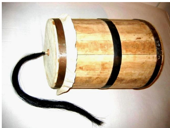
Foto 1. Model de buhai tradițional (colecția personală de instrumente, Ovidiu Papană)

Buhaiul – un instrument emblematic al culturii noastre tradiționale, folosit în manifestările culturale prilejuate de sărbătorile de iarnă, este la ora actuală întâlnit tot mai rar în activitățile folclorice. Utilizarea sa are un caracter zonal și este destul de restrânsă, acest instrument tradițional fiind folosit doar la colindatul cu „plugușorul”. Buhaiul face parte încă din recuzita cetelor de colindători din Moldova și (în mod parțial) din zonele limitrofe ale acestei regiuni.