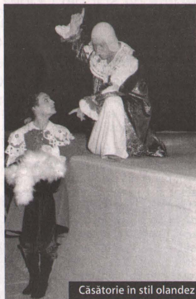
Căsătorie în stil olandez

Ce mă interesează, însă, în cadrul unui spectacol, este ca aceste trei forme de manifestare să fie echilibrate și cât se poate de armonios împletite, pentru a crea sentimentul de "frumos". Spectacolele bune sunt multe, dar spectacolele frumoase sunt rare și nu cred că teatrul românesc este suprasaturat de așa ceva.