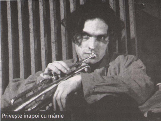
Privește înapoi cu mânie