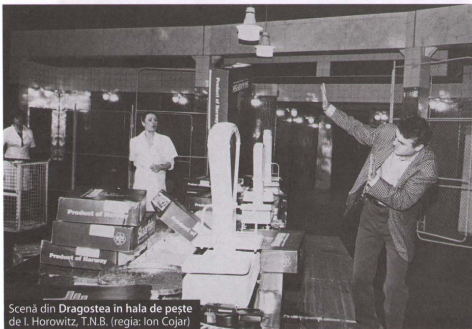
Scenă din Dragostea în hala de pește de I. Horowitz, T.N.B. (regia: Ion Cojar)

Anchetă realizată de Mirona Hărăbor și Marinela Țepuș