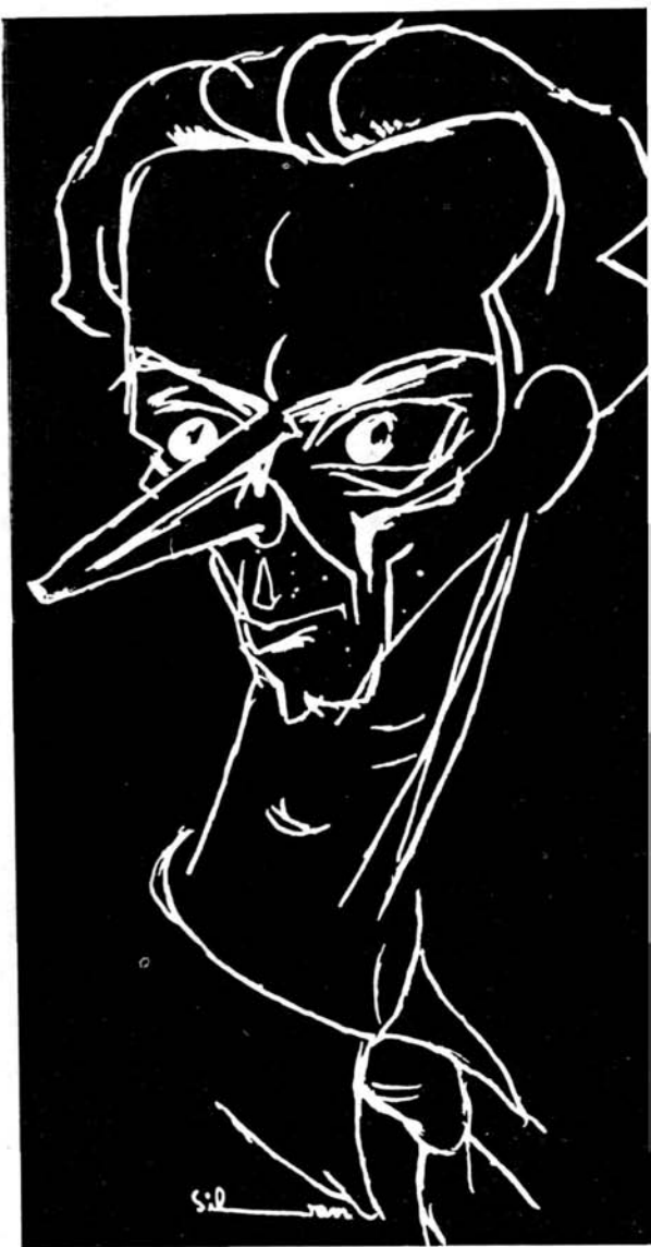
N. Tomazoglu, văzut de Silvan