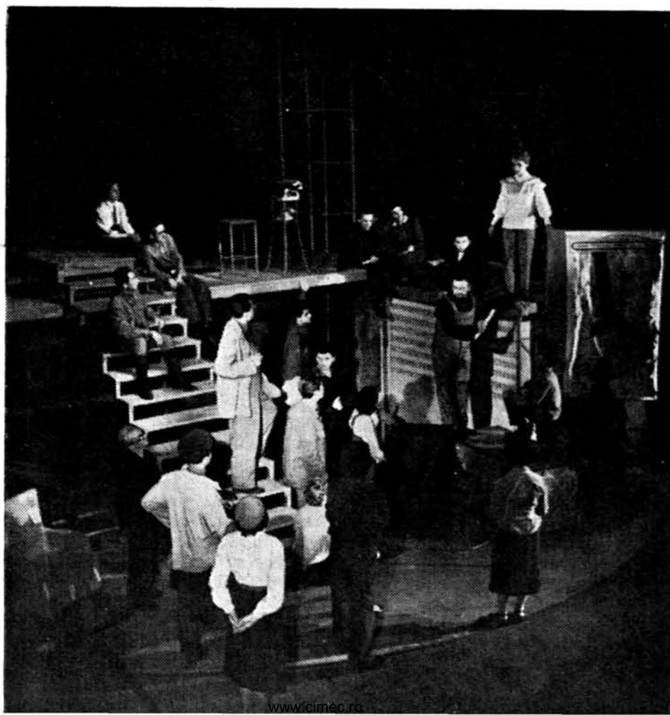
Scenă din „Baia” de Maiakovski (Teatrul Muncitoresc C.F.R. — regia Horea Popescu)